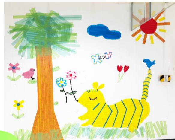
※おだわら・コドモ・アートの作品